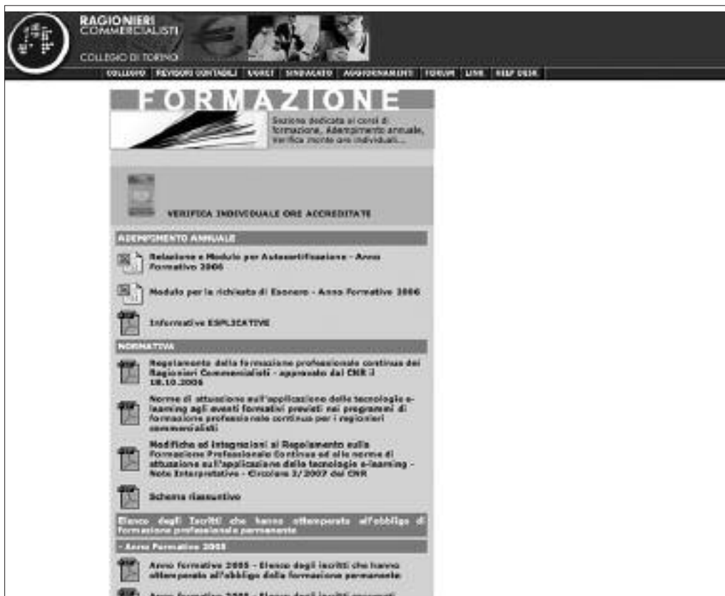
A fianco: www.ragionieri.com/-formazione/indice/default.aspx

te nel Codice deontologico, da parte di un iscritto all'Albo può essere sanzionata con provvedimenti disciplinari allorché infici il decoro e la dignità della professione; che la partecipazione della professione di ragioniere alle organizzazioni internazionali della professione induce a prevedere la formazione professionale permanente e le modalità di adempimento e di monitoraggio della stessa; che, in particolare, si rende necessario dare attuazione alla International Education Guideline n. 2 emanata dall'IFAC - International Federation of Accountants ed ai successivi standard