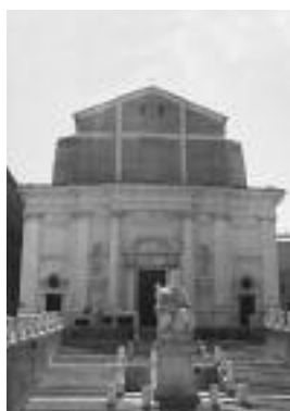
Ancona, Piazza del Plebiscito.

La Redazione di Professio ritiene di focalizzare l'attenzione dei colleghi su due argomenti di primaria importanza riportati in questo numero: