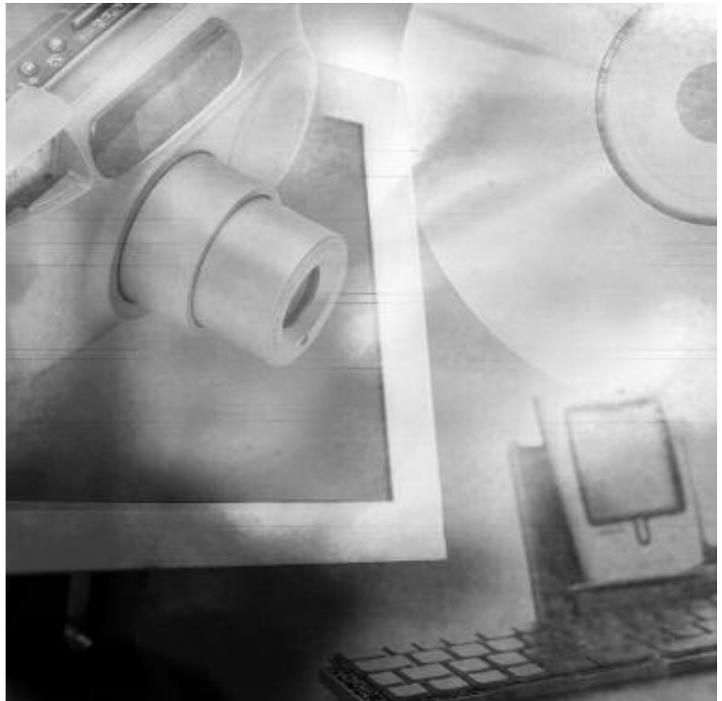
A fianco: Gli "ingredienti" dell'E-Learning.

se gli obiettivi di apprendimento indicati sono stati raggiunti; se i prerequisiti erano appropriati; se i materiali didattici contenevano inesattezze; se i materiali didattici erano pertinenti e se hanno contribuito al raggiungimento degli obiettivi di apprendimento; se il tempo dedicato all'attività di apprendimento era adeguato; se applicabile, se i singoli istruttori erano efficaci; se la sede o l'equipaggiamento tecnico erano adeguati; se i materiali distribuiti per la preparazione preventiva erano soddisfacenti; se i materiali didattici audiovisivi erano efficaci.